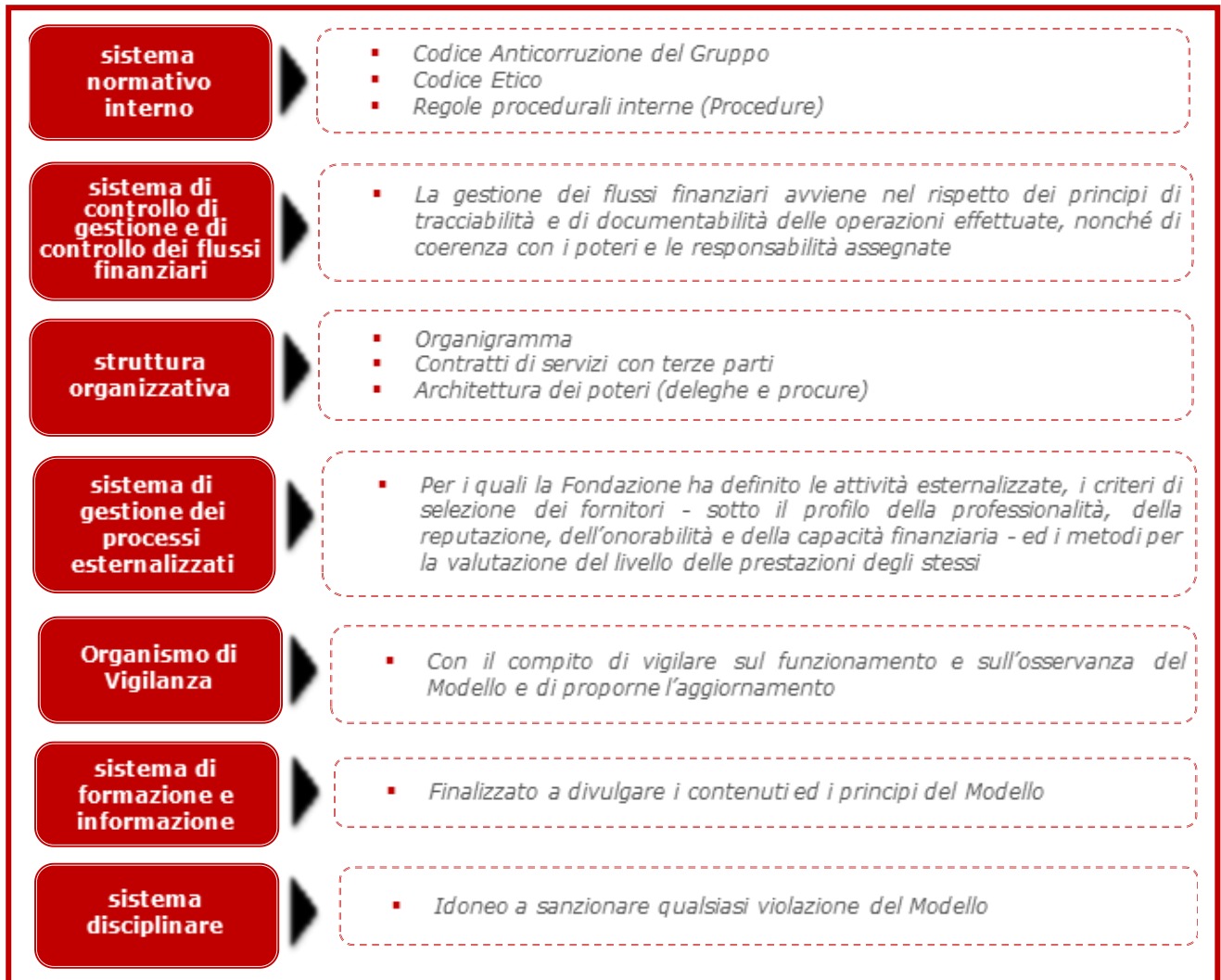
Le componenti del Modello della Fondazione