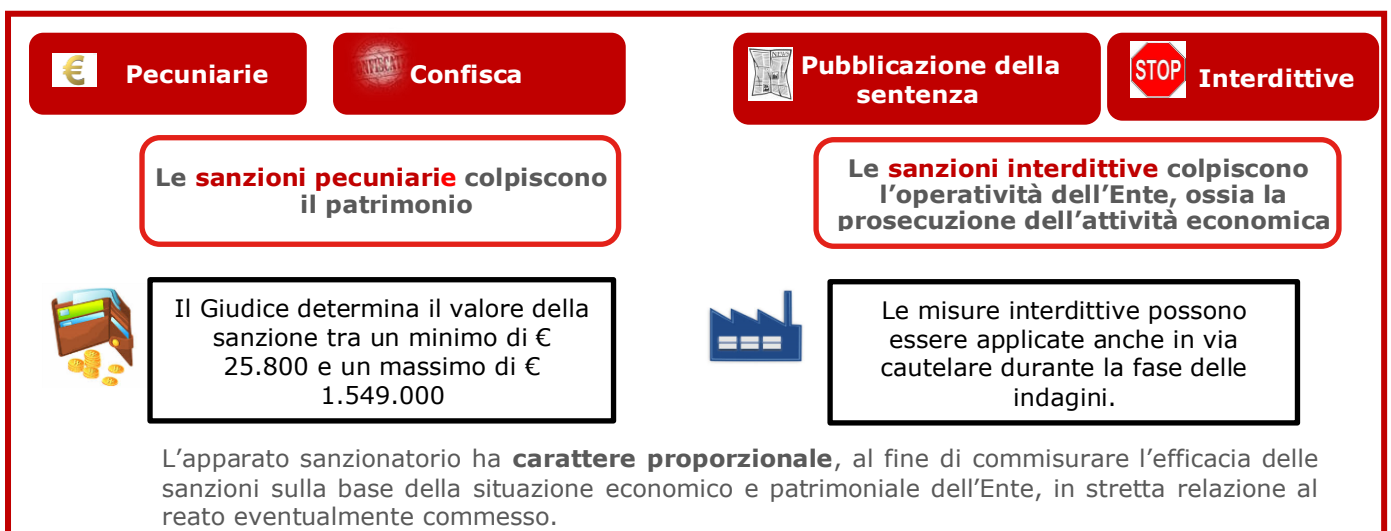
Il sistema sanzionatorio per gli Enti

La pubblicazione della sentenza di condanna può essere disposta quando nei confronti dell'Ente viene applicata una sanzione interdittiva ed è eseguita a spese dell'Ente (art. 18).