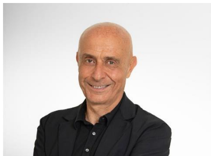
Marco Minniti, Presidente